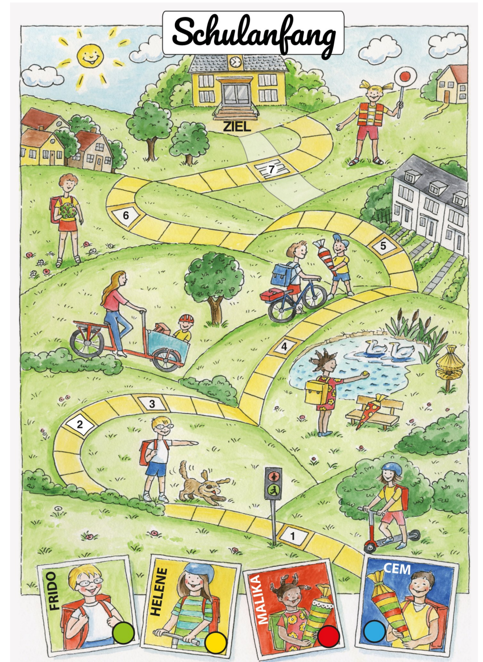
(Text & Bild: Anna Zeis-Ziegler - In: Pfarrbriefservice.de)