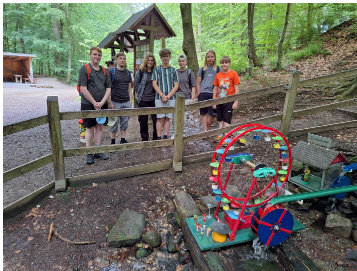
Eine Wanderung zu den Wenniger Wasserrädern samt Picknick stand im Mai auf unserem Programm.