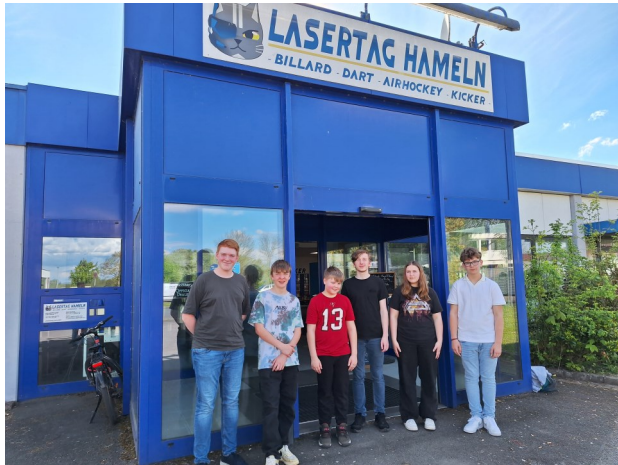
Im April hieß es: Action im Lasertag Hameln.

Wir, die Messdienerinnen und Messdiener der St. Johannes der Täufer-Gemeinde, treffen uns einmal im Monat, um für die Gottesdienste zu üben, Gemeinschaft zu erleben und miteinander Spaß zu haben. Hier ein Einblick in unsere letzten Aktivitäten: